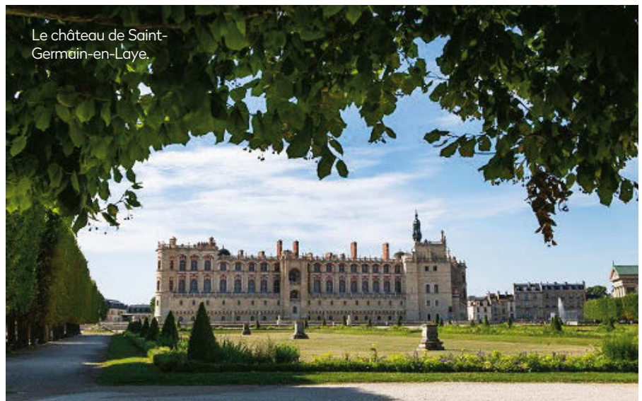
Le château de Saint-Germain-en-Laye.

Lancé en 2023 par la Fondation du patrimoine, le programme « Patrimoine roman » – ayant pour but de soutenir la préservation et la restauration des édifices – a récompensé cinq nouveaux projets, dont ceux de Notre-Dame-la-Grande de Poitiers (Vienne) et du prieuré Saint-Étienne de Bruère-Allichamps (Cher). Siège du musée d'Archéologie nationale, le château de Saint-Germain-en-Laye (Yvelines) a intégré la liste des domaines nationaux, désormais au nombre de vingt et un : il rejoint notamment les châteaux de Chambord et de Versailles. Enfin, mieux vaut tard que jamais : plus de soixante ans après leur vol, quatre statuettes en bois du XVIII e siècle regagnent l'église de l'abbaye de Saint-Sever-de-Rustan (Hautes-Pyrénées). Classées aux Monuments historiques, elles ont été retrouvées grâce à la collaboration de la gendarmerie et des archives départementales.