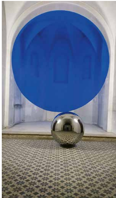
Deux œuvres de Georges Rousse et de Vladimir Skoda, à Cuiseaux.

Les informations communiquées sont susceptibles de modifications de dernière heure.