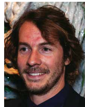
Jean-Charles Hameau.